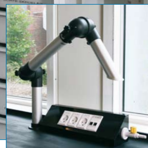
▲ Elevarbejdspladser bør have el, gas, it, og udsugning indenfor praktisk rækkevidde. Her løst ved et bord'display'.

ST Skoleinventar A/S' løsninger er synergi mellem stor viden om ergonomiske principper og konsekvent brug af de mest holdbare materialer.