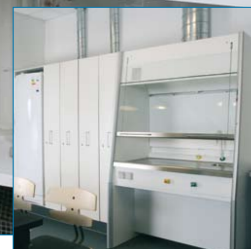
▲ Stinkskab og ventilerede opbevaringskabe til kemikalier er vigtige elementer i et moderne naturvidenskabslokale.