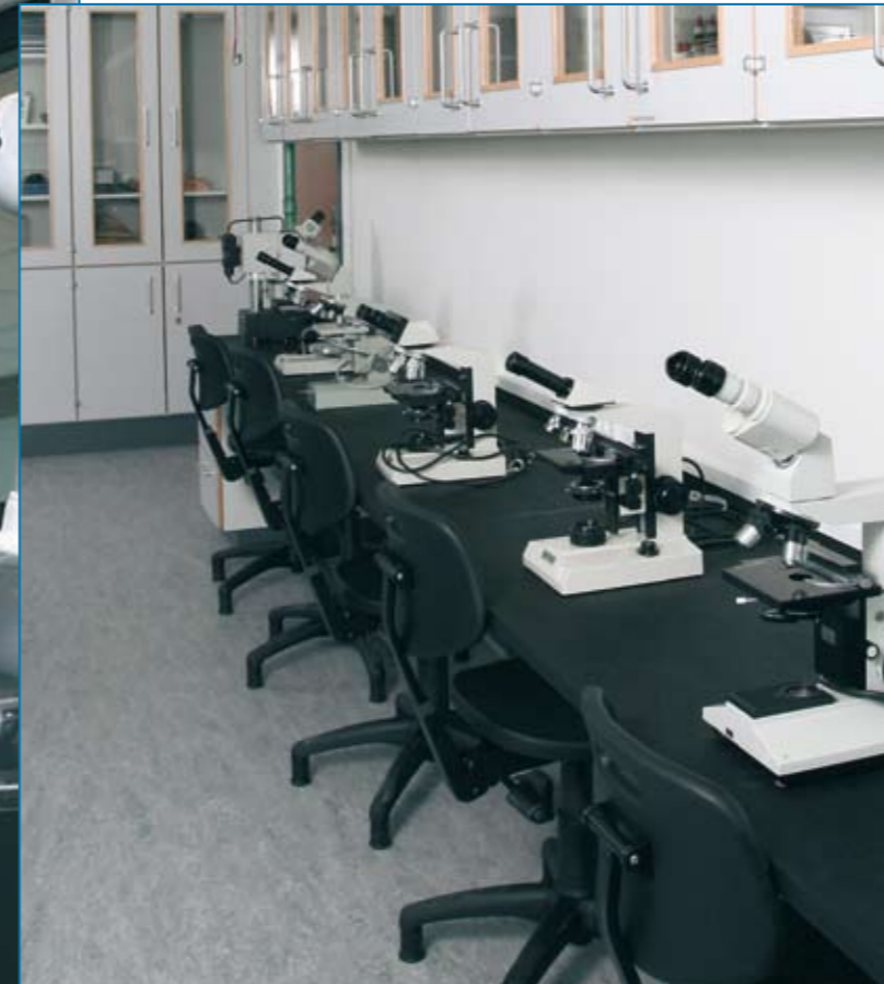
▲ Plads til iagttagelse og fordybelse – de nødvendige rekvisitter findes i skabe ovenfor.