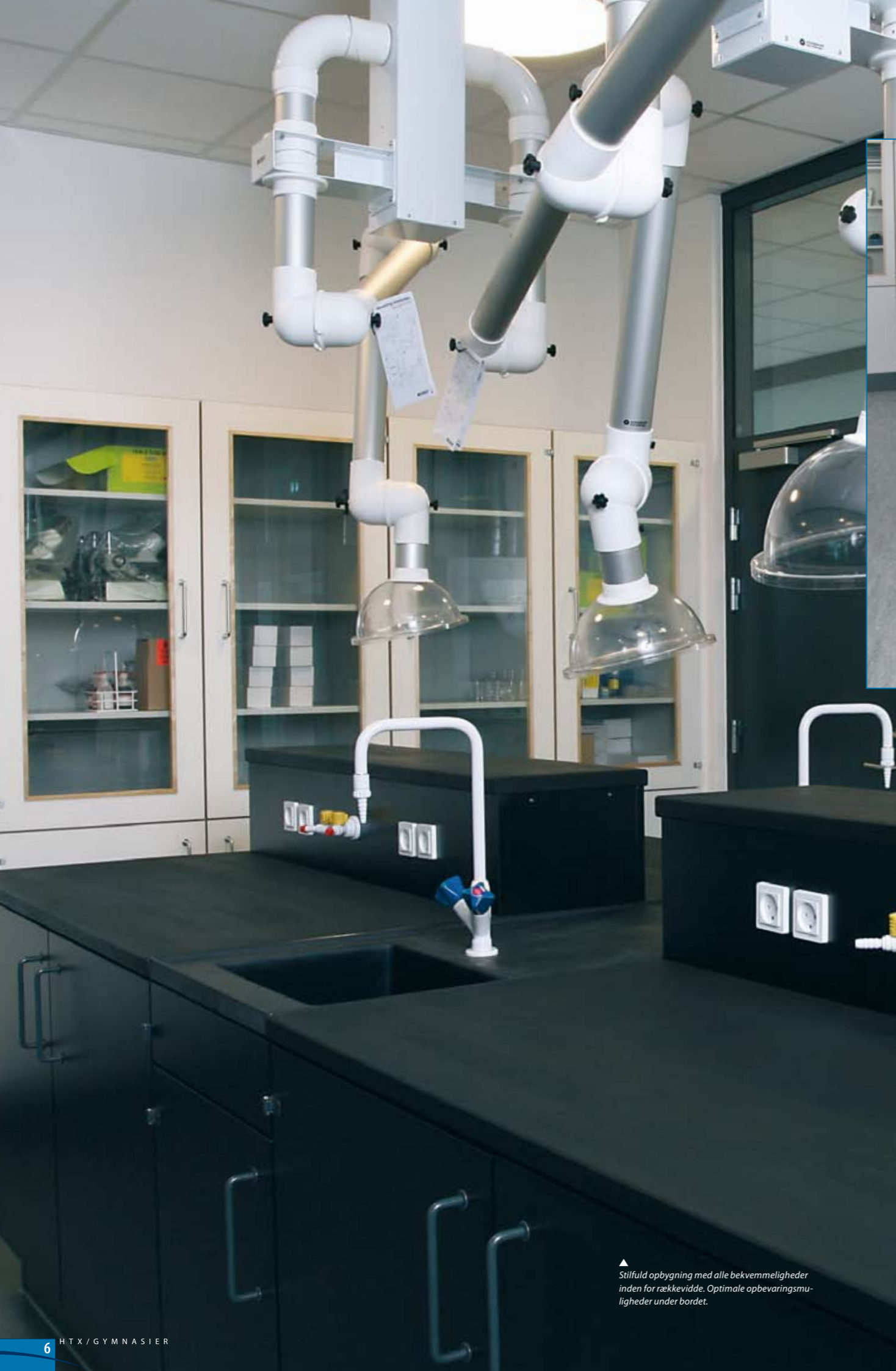
▲ Stilfuld opbygning med alle bekvemmeligheder inden for rækkevidde. Optimale opbevaringsmuligheder under bordet.