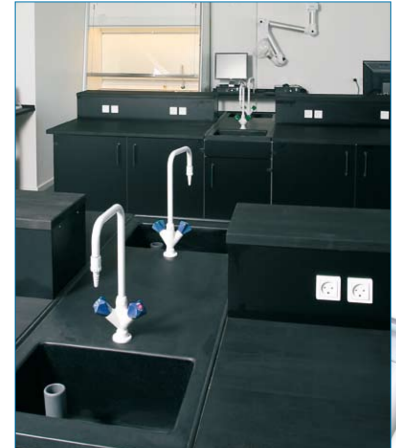
▲ Enkle farver, hensigtsmæssig opstilling og rum til læring via eksperimenter.